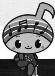
郡山市イメージキャラクター 「がくとくん」

会 期 平成26年 8 月 7 日(木)～9 日(土) 会 場 郡山総合運動場 開成山陸上競技場